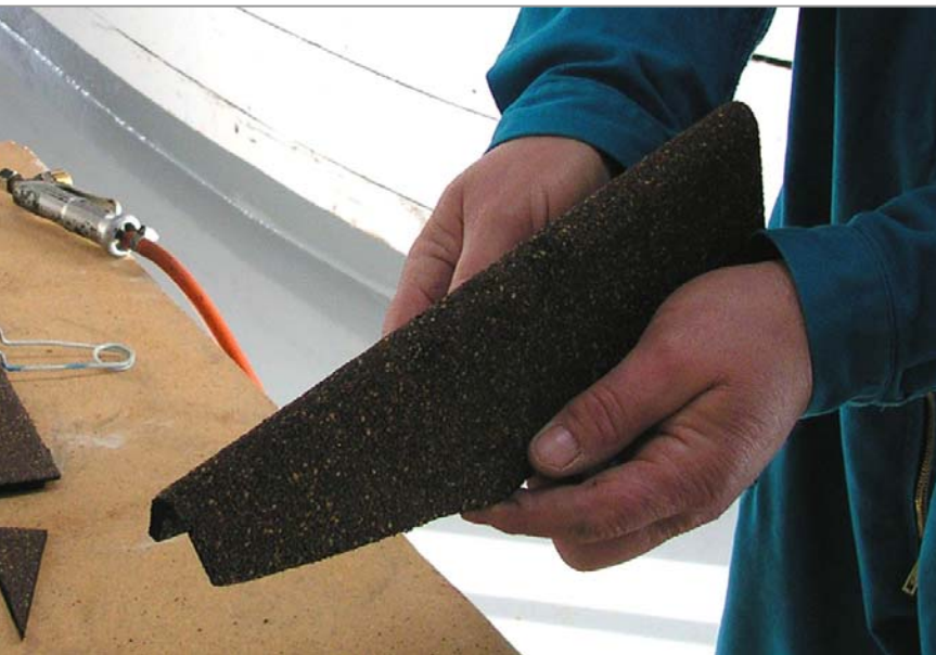
Сгибаем по оси