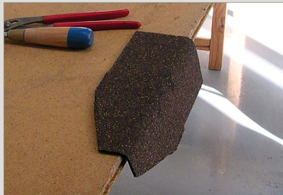
Фиксируем по месту двумя гвоздями