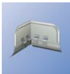
OSK Ограничитель перелива, угловой