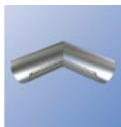
RVI Внутренний угол желоба