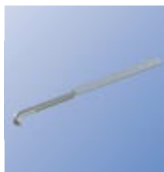
STAG Подвесная лента