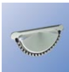
RGT Заглушка желоба