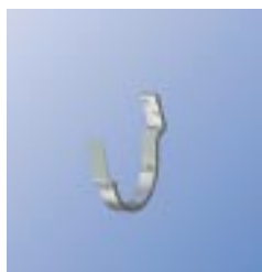
K11 Крюк для кровли с уклоном 27°