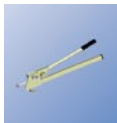
KBO Клещи для крюков