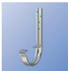
SKL/SKM Крюк с замком-защелкой, M, L, XL