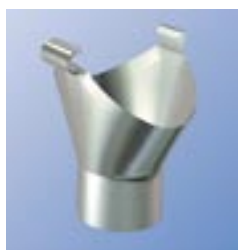
SOK Водоприемная воронка с защелкой