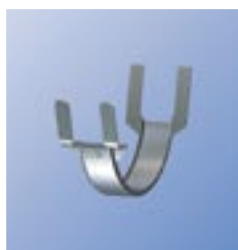
TB Декоративная накладка