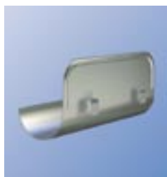
OSKR Ограничитель перелива