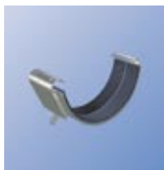
RSK Соединитель желоба