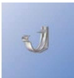
SSK Крюк регулируемый под нужный уклон