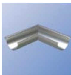
RVY Внешний угол желоба